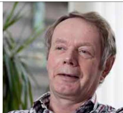
Geen indexatie - wat vindt u ervan?

Het bestuur heeft eind 2010 ook besloten het indexatiebeleid aan te passen, om nog slagvaardiger te kunnen werken aan het herstel van de reserves van het fonds. Meer daarover leest u op pagina 7.